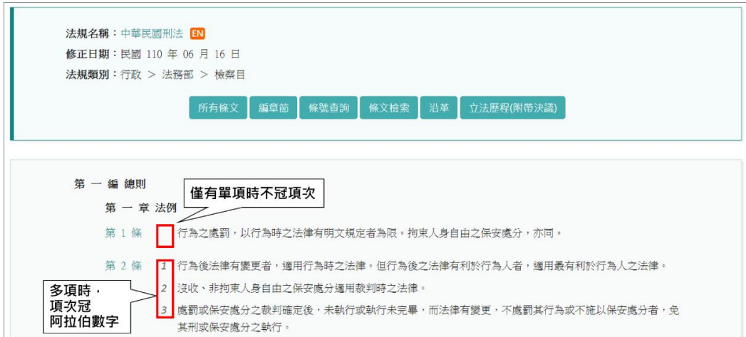
圖 1：法規增冠項次示意圖

考量民眾查閱法規時，常有誤認法規項次之困擾，「全國法規資料庫」現行有效中央法規條文於法規有數項時，於每項前以適當之阿拉伯數字方式增冠項次編號，若法規條文僅單項時，則不冠項次編號。