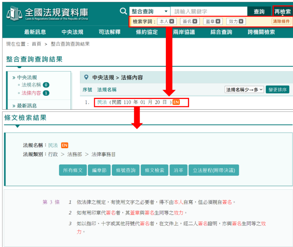
圖 3：「再檢索」功能示意圖

為利民眾於「整合查詢」輸入檢索詞彙後，可對查詢結果進行較精確的再檢索，「全國法規資料庫」於首頁「整合查詢」功能，新增「再檢索」服務，提供民眾可依需求，自行新增或刪除多組檢索詞彙，以快速精準查得所需法規。