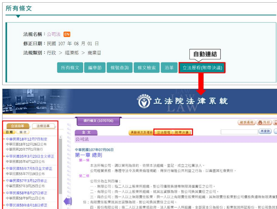
圖 2：「立法歷程(附帶決議)」功能自動連結示意圖

為利民眾查找具法律位階法規之立法歷程（含附帶決議），提供民眾於「全國法規資料庫」點擊「立法歷程（附帶決議）」功能，可自動連結至「立法院法律系統」呈現查找法規之歷次立法與修法異動條文與立法理由、立法歷程及附帶決議等資訊。